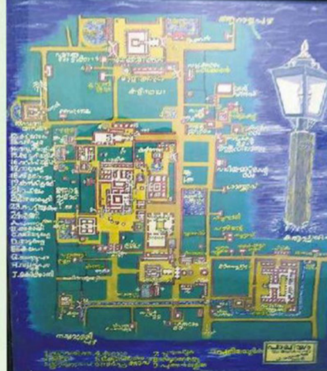
ചേന്ദമംഗലത്തിന്റെ പഴയ മാപ്പി

കൊടുങ്ങല്ലൂരിൽ മുസിരിസ് പദ്ധതിയുടെ ഭാഗമായി 16 കിലോമീറ്റർ പ്രദേശത്താണ് മുസിരിസ് പൈതൃക വിനോദസഞ്ചാരത്തിനുള്ള ബോട്ട് ജെട്ടികൾ ഒരുക്കിയിട്ടുള്ളത്. 10 ബോട്ട് ജെട്ടികൾ ഒരുക്കിയ ജലപാതയുടെ തീരത്തെ ഏഴു മ്യൂസിയങ്ങളും 31 പൈതൃക കാഴ്ചകളുമാണു പദ്ധതിയുടെ ഒന്നാംഘട്ടത്തിൽ രാഷ്ട്രപതി നാളെ ഉദ്ഘാടനം ചെയ്യുന്നത്. നാടിന്റെ സഹന പദ്ധതി പൂർത്തിയാകുമ്പോൾ കേന്ദ്ര-സംസ്ഥാന സർക്കാർ വിഹിതം 600 കോടി രൂപ കവിയും. ഇതിനൊപ്പം അടുത്ത മുസിരിസ് പൈതൃക വിനോദസഞ്ചാരത്തിനുള്ള ബോട്ട് ജെട്ടികൾ 29 മ്യൂസിയങ്ങൾ, 10 സെന്റ് മ്യൂസിയങ്ങൾ, 50 അനുബന്ധ സന്ദർശക കേന്ദ്രങ്ങൾ എന്നിവയുണ്ടാകും. ഒരേ ഒരു ടിക്കറ്റിൽ മുഴുവൻ ബോട്ടുയാത്രയും മ്യൂസിയം കാണലും സാധ്യമാകും. മുസിരിസിലെ ടിക്കറ്റ് നിരക്കുകൾ: ഹോപ്പ് ഓൺ ഹോപ്പ് ഓഫ് സർവീസ്: മുതിർന്നവർക്ക് 550 രൂപ (ഒരു ദിവസത്തേക്ക്) കുട്ടികൾക്ക് 400 രൂപ. പത്തുപേരിൽ കുറയാത്ത വിദ്യാർഥി സംഘങ്ങൾക്ക് 325 രൂപ. വാട്ടർ ടാക്സി (സ്പീഡ് ബോട്ട്): 3000 രൂപ (മണിക്കൂറിന്) (വിദേശികളുടെ നിരക്കു ഡോളർ വിനിമയ നിരക്ക് അനുസരിച്ചു മാറ്റം വരുത്തും) കുട്ടികൾക്ക് 500 രൂപ. വാട്ടർ ടാക്സി: 3000 രൂപ (മണിക്കൂറിന്) (വിദേശികളുടെ നിരക്കു ഡോളർ വിനിമയ നിരക്ക് അനുസരിച്ചു മാറ്റം വരുത്തും) കുട്ടികൾക്ക് 500 രൂപ. www.keralatourism.org/muziris/