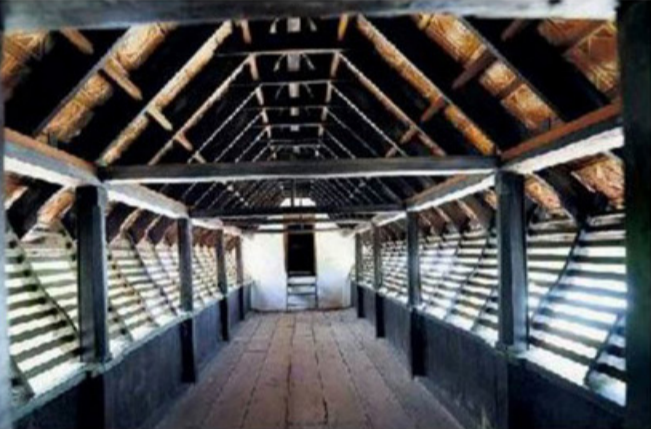
കേരളീയ വാസ്തുശൈലിയിലുള്ള പറമ്പൂർ ജ്യോതിർലിപിയുടെ തുറന്നുപുറം ഭാഗം.