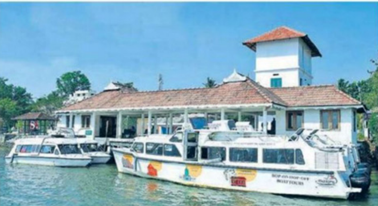
'റോഡ് ഓൺ റോഡ് ഓഫ്' ബോട്ടുകൾ.

ചരിത്രം അറിയാത്തവർ അതിനടിയിൽ വിശ്വസിച്ചിരുന്നേക്കാം. 'റോഡ് ഓൺ റോഡ് ഓഫ്' ബോട്ടിംഗിന് അനുകൂലമായ വീശും മണലും കൈമാറ്റം ചെയ്തതിനുശേഷം മഴക്കാലം മുഴുവൻ ആയിരക്കണക്കിന് വിളാർലിയർമാർ ഈ കരണങ്ങളിൽ മുക്കിയിരിക്കുകയാണ്. ഇതാണ് 'റോഡ് ഓൺ റോഡ് ഓഫ്' ബോട്ടിംഗിന്റെ ആദ്യം. ഈ കരണങ്ങളിൽ കയറിയിരുന്ന് കിഴക്കോട്ട് സഞ്ചരിക്കുന്നതിന് സാധ്യമാണ്. ഇത് തുറന്നു നോക്കിയാൽ അവിടെ നൂറുകണക്കിന് റിപ്പോർട്ടുകൾ ഉണ്ടാകാറുണ്ട്. ഈ സമയത്ത് വെള്ളത്തിലെ സുന്ദരത്വം ആസ്വദിക്കാനും മറ്റുമുള്ളവർക്ക് ഇത് മറ്റൊരു വെള്ളത്തിലേക്ക് മാറിപ്പോകാൻ സാധ്യമാണ്. ഈ സമയത്ത് വെള്ളത്തിലെ സുന്ദരത്വം ആസ്വദിക്കാനും മറ്റുമുള്ളവർക്ക് ഇത് മറ്റൊരു വെള്ളത്തിലേക്ക് മാറിപ്പോകാൻ സാധ്യമാണ്.