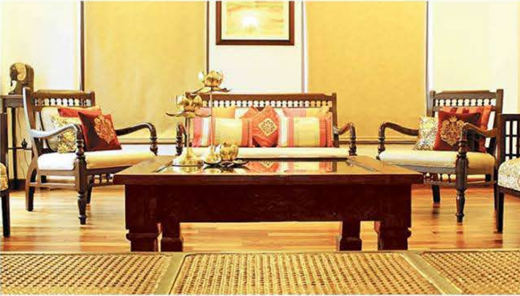
പുറംകാഴ്ചയിലല്ല, സൗകര്യവും ഉപയോഗക്ഷമതയും തുളുമ്പുന്ന വീടുകളിലാണ് ജീവിതം കൂടുതൽ സുഖകരമാകുന്നത്.

ത്കാരത്തിലേക്ക് കൂടുതൽ അടുപ്പിക്കുക എന്നതുമാണ്. അറിവിനോടൊപ്പം പൈസ ലഭിക്കാൻ കൂടി കഴിയുകയാണെങ്കിൽ വളരെ നല്ലത്. എന്താണ് ആഗ്രഹിക്കുന്നതെന്ന് നിങ്ങൾക്കുതന്നെ ധാരണയുണ്ടെങ്കിൽ, ആർക്കിടെക്ടിനോട് നിങ്ങൾ ഉദ്ദേശിക്കുന്ന കാര്യം ചോദിച്ചു വാങ്ങുകയും ചെയ്യാം. കരയുന്ന കുഞ്ഞിനെ പാലുള്ളൂ എന്നു പറയുന്നപോലെ... വീടുപണിതവരെല്ലാം പറയുന്ന ഒരു കാര്യമുണ്ട് - “അടുത്ത പ്രാവശ്യം വീടു പണിയുമ്പോൾ ഈ തെറ്റൊന്നും വരുത്തില്ല” എന്നത്. എന്നാൽ സാധാരണയായി ഒരാൾ ആയുഷ്കാലത്തിൽ ഒരു വീടു മാത്രമേ പണിയാറുള്ളൂ.